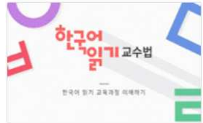
한국어 읽기 교수법

* 3개 연수 중 1개 이상 수강자 우대( https://kcenter.korean.go.kr )