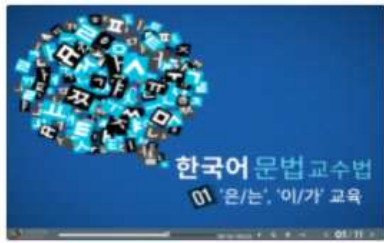
한국어 문법 교수법