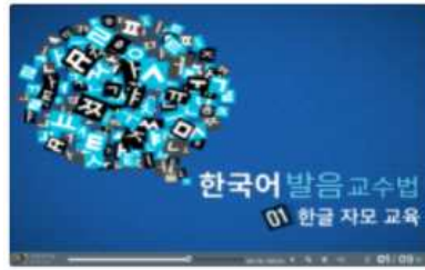
한국어 발음 교수법