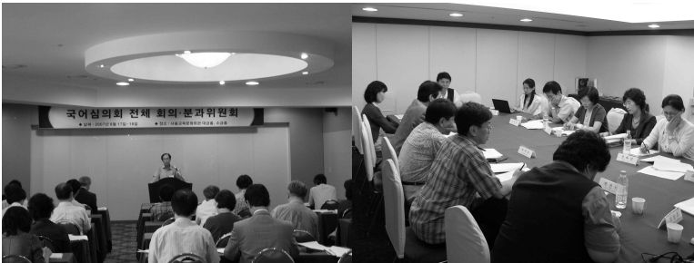
▲ 국어심의회 전체 회의(왼쪽)와 분과별 회의(오른쪽)

8월 18일 오전 9시부터 시작된 전체 회의에서는 그동안 실무위원회에서 검토했던 운영 내규를 확인·수정하였으며 분과별로 전달 있었던 회의 결과를 보고하였다. 그리고 두 건의 건의문 초안을 검토하여 문안을 수정하였다. 마지막으로 영어 문제에 대한 대처 방안을 논의하였으나 시간 관계로 실무위원들이 분과를 대표하여 지속적으로 논의하기로 하였다.