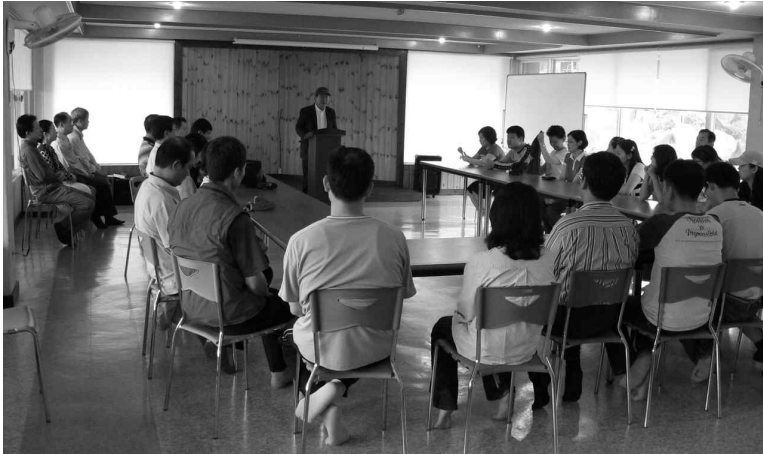
▲ 혁신 워크숍 주제 토론