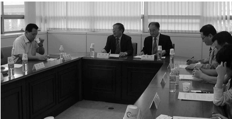
▲ 협의회에 참석한 교육부, 국립국어원, 노동부, 여성가족부 관계자