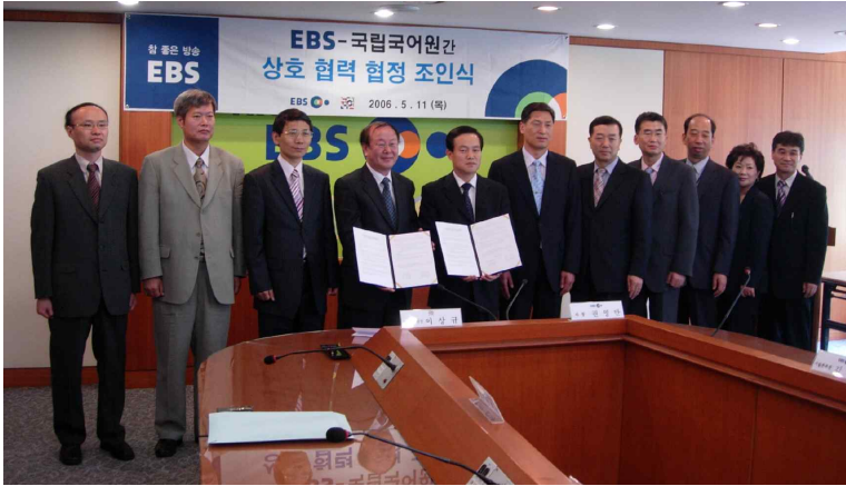
국립국어원과 EBS 교육방송의 업무 협정식