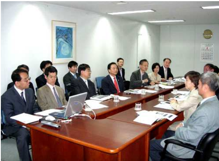
김명곤 장관이 업무 보고를 받는 모습

2006년 4월 27일 김명곤 문화관광부 장관이 국립국어원을 방문하여 국어원의 주요 업무 계획을 보고받고 직원들을 격려하였다.