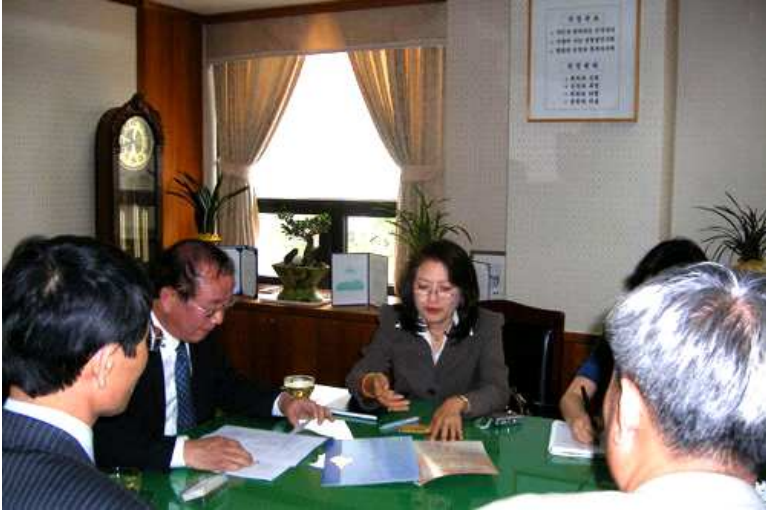
친마나 판콕 태국 왕실연구소 사무총장이 방문 취지를 말하는 모습

을 나타내며 국립국어원의 사전 편찬 경험을 배울 수 있기를 희망하였다. 이상규 국립국어원장은 한국과 태국의 관계는 앞으로 더욱 밀접해질 것이라고 전망하면서 한국 정부가 태국인 이주 여성의 교육에 신경을 쓰는 만큼 태국 정부도 태국 내의 한국어 교사들을 적극적으로 지원해 줄 것을 부탁하였다.