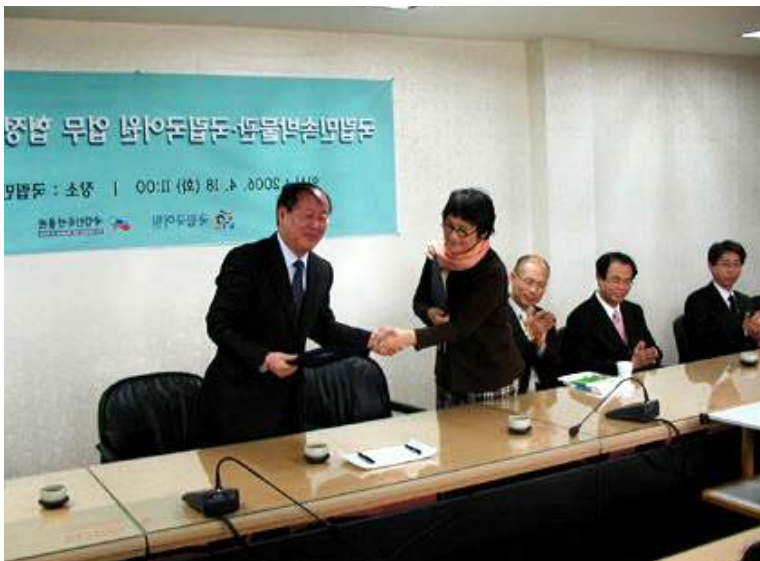
국립국어원과 국립민속박물관의 업무 협정식