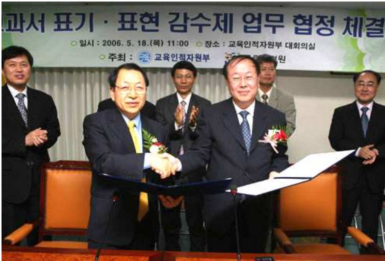
국립국어원과 교육인적자원부의 업무 협정 체결식

다. 엠파스( http://www.empas.com )의 검색창에서 ‘뽀뽀, 시다바리’ 등 다듬을 말을 검색하면 ‘일 바지, 밀일꾼’ 등의 다듬은 말이 맨 위에 검색 결과로 나타난다.